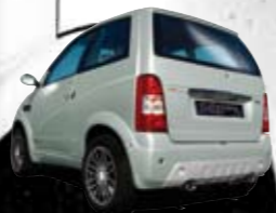
Or Blanc métal