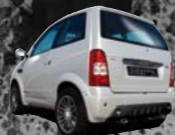
Gris Silver métal