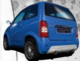
Bleu Cyclade métal