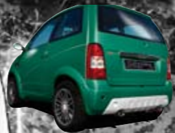
Vert Opale métal